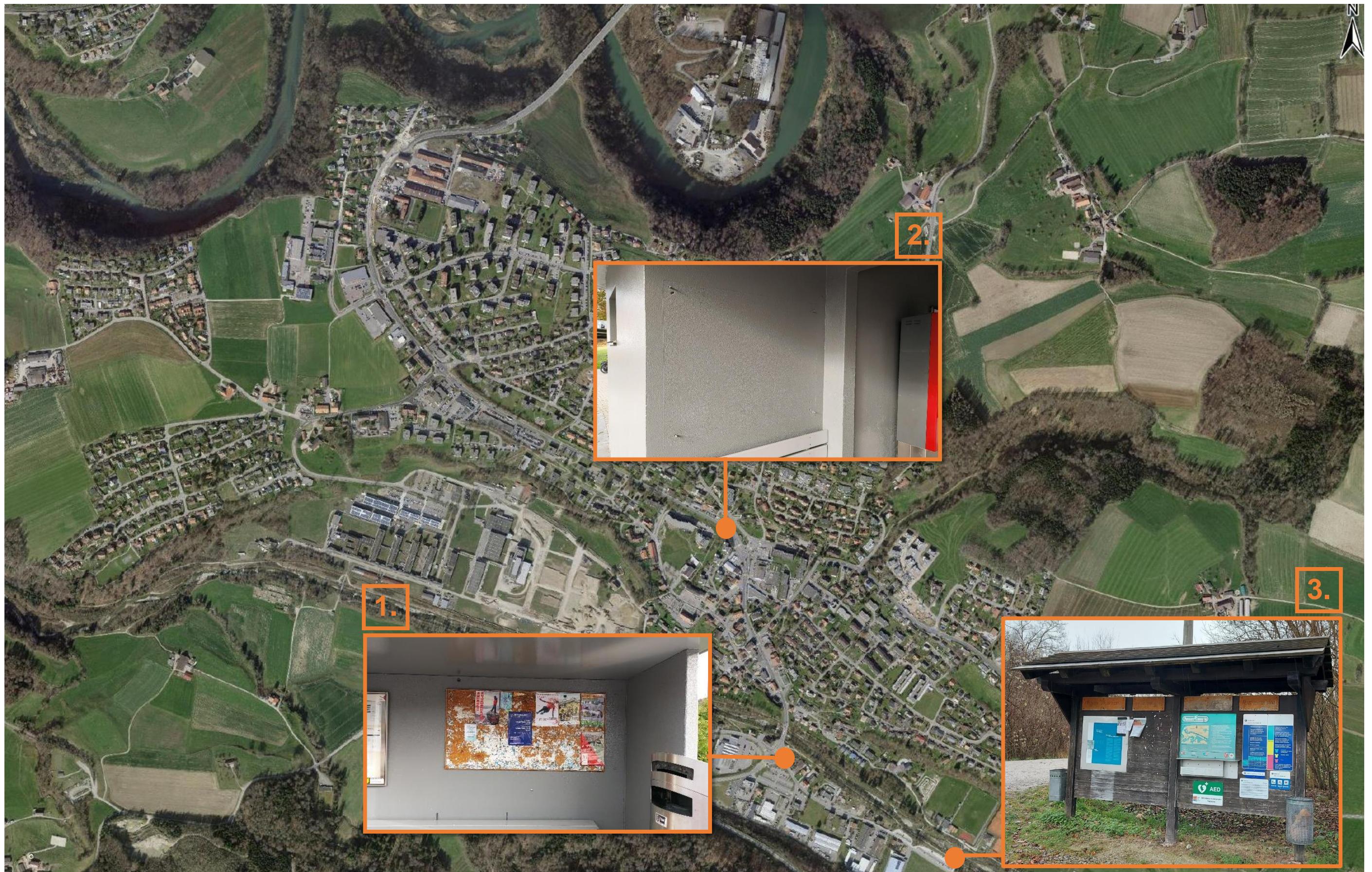
1. Arrêt de bus « Gérine »