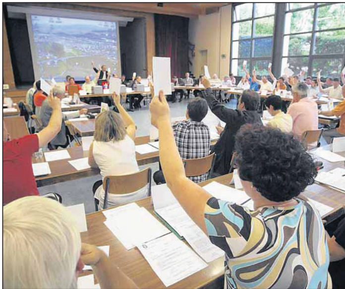
Le PDC et Marly-Voix ont perdu des plumes lors de l'élection au Conseil général. CHARLY RAPPO-À

Déjà peu nombreuses au sein du Conseil général entre 2006 et 2011, les