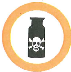
Produits toxiques et chimiques