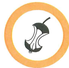
Restes de nourriture, marc de café