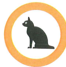
Litières de chats